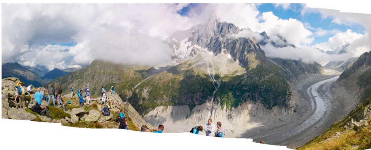
anorama de la Mer de Glace avec une partie du groupe lors du « Mid-Conference field trip ».