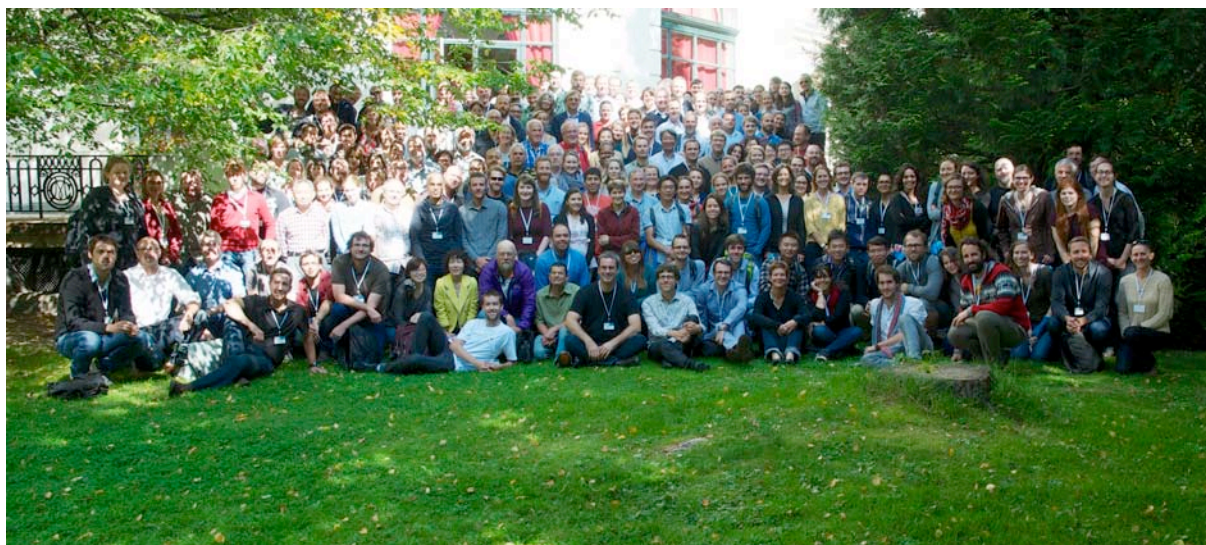
Photo de groupe des participants au congrès, devant le palais des congrès de Chamonix.