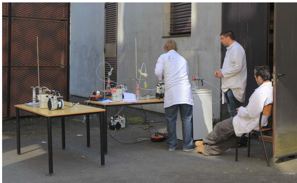
Figure 2 : prélèvements des différents composés étudiés devant la Halle de TP