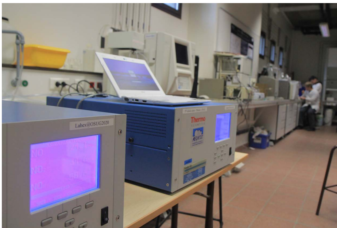
Figure 4 : mesure en continu de l'ozone et des oxydes d'azote sur le site du TP au cours des deux semaines grâce aux analyseurs Thermo-Scientific

Ce suivi continu a présenté plusieurs intérêts au cours du module :