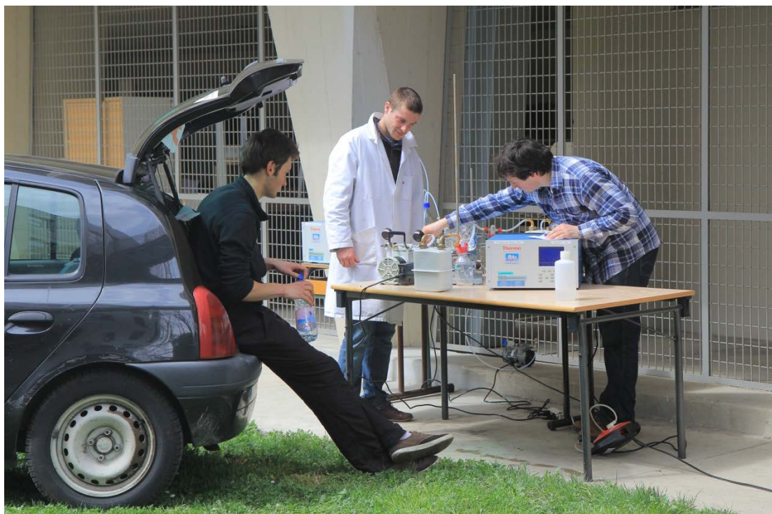
Figure 6 : tentative de mise au point expérimentale de la mesure du NO à l'aide des analyseurs Thermo-Scientific