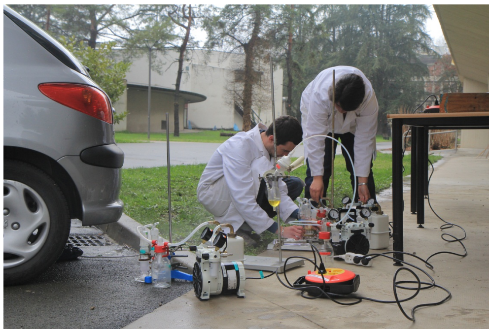
Figure 3 : prélèvements réalisés près d'une source automobile

En parallèle aux tests et mesures réalisés par les étudiants, un suivi continu des teneurs en ozone et oxydes d'azote a été réalisé tout au long de la période des TP sur le site même des expériences, grâce aux analyseurs Thermo-Scientific acquis dans le cadre de ce projet.